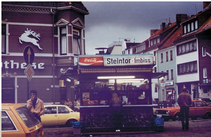
Steintor-Imbiss 1980